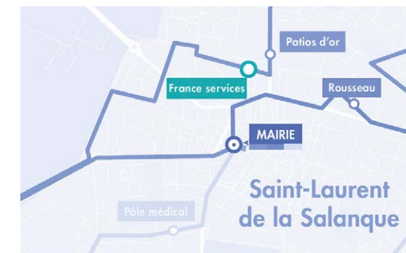
Saint-Laurent-de-la-Salanque (66) Zoom sur la plaquette de transport de Saint-Laurent-de-la-Salanque

Un arrêt de bus ou de tramway proche de la France services facilite toujours sa connaissance par les passants. Un arrêt de bus nommé "France services" est une étape de plus pour bien être identifié.