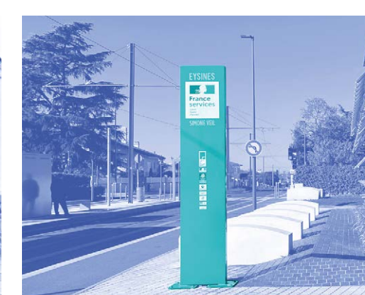
Le totem fixe d'Eysines (33)