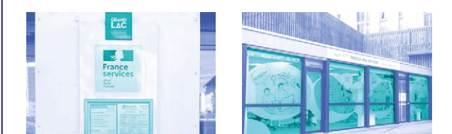
Entrelacs (73) Réduire l'espace d'affichage est un moyen simple pour réduire et prioriser les informations.