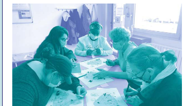
Rezé (44) Un atelier usagers pour dessiner la vitrophanie

Avant d'afficher des informations sur la vitrine, il peut être utile de demander l'avis des usagers, de leur poser des questions pour vérifier leur compréhension des informations depuis l'extérieur (missions France services, horaires des permanences, ...).