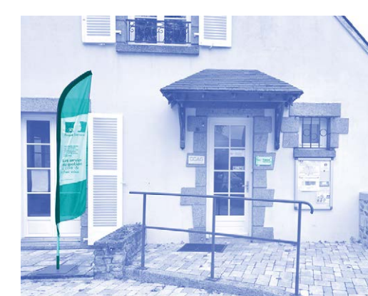
L'oriflamme d'Evron (53)