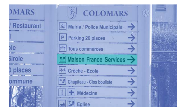
Colomars (06) Panneaux d'indication piéton

Avoir une signalétique à échelle piéton qui flèche la direction de la France services facilite son accès. S'il existe des panneaux déjà installés, inutilisés (exemple : commerce fermé), il est possible de simplement ajouter des autocollants France services.