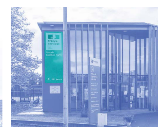
La façade de Castillon (33)