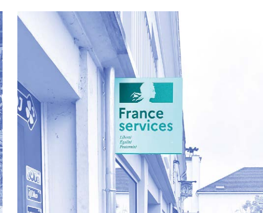
L'enseigne d'Arcis-sur-Aube (10)