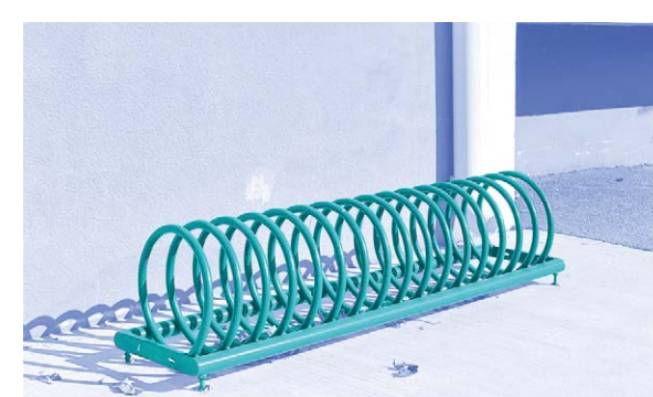
Saint-Laurent-de-la-Salanque (66) Le rack à vélo

Apaiser les abords aux alentours d'une France services permet d'utiliser toutes les possibilités du parvis, de discuter avec les usagers dehors, ..., tout en laissant des places aux voitures et aux vélos pour se garer à proximité.