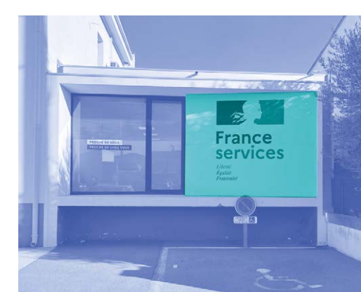
L'immense sticker de Saint-Laurent-de-la-Salanque (66)

La carotte ou l'enseigne indiquent de loin l'identité de la structure. Si votre contexte vous empêche d'en avoir une, vous pouvez aussi utiliser les totems, oriflammes ou surfaces planes pour afficher votre identité.