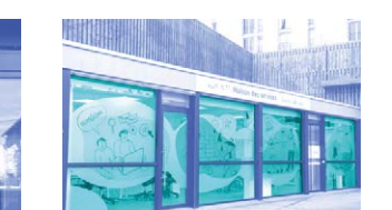
Rezé (44) Illustration de la mission de la France services sur la vitrophanie.